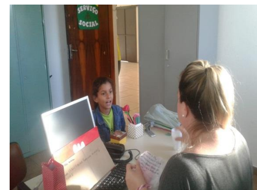
Fig.06 Escuta individualizada 18/07/19

Obs.: A meta 02 será realizada no segundo semestre.