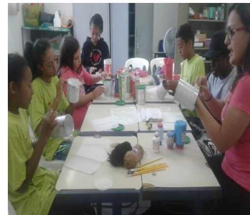
Fig.03 Oficina Artes 10/03/19