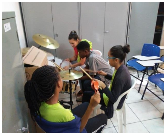
Fig.02 Oficina Música 15/07/19