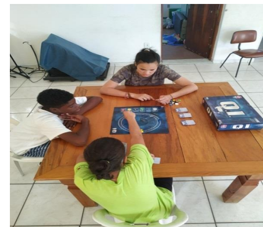
Fig. 05 jogos recreativos 23/07/19