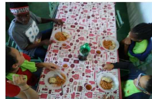
Fig. 03 12/07/19