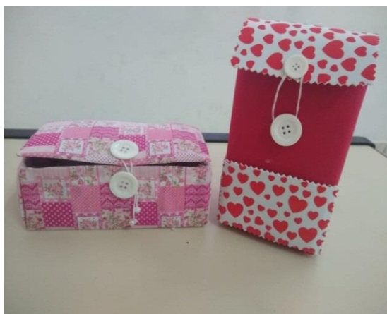
Fig.04 Oficina de Artes 24/07/19