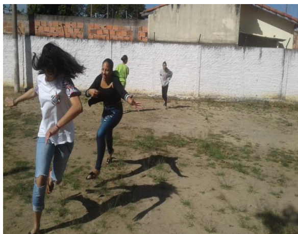
Fig.04 Lazer pega-pega