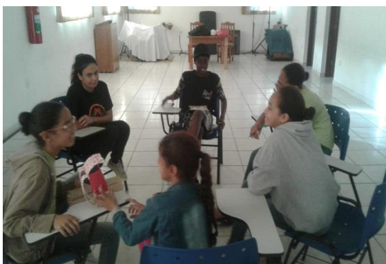
Fig.04 Acolhimento diário 25/07/12