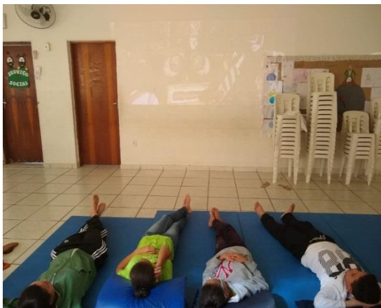
Fig.01 Psicossocial Filme Wall-E 22/07/19