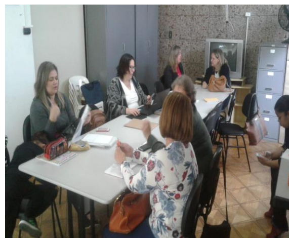
Fig. 02 reunião CMDCA 04/07/19