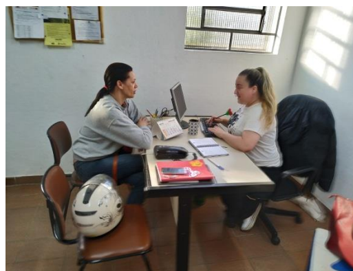
Fig. 05 Enc. Conselho Tutelar 08/07/19