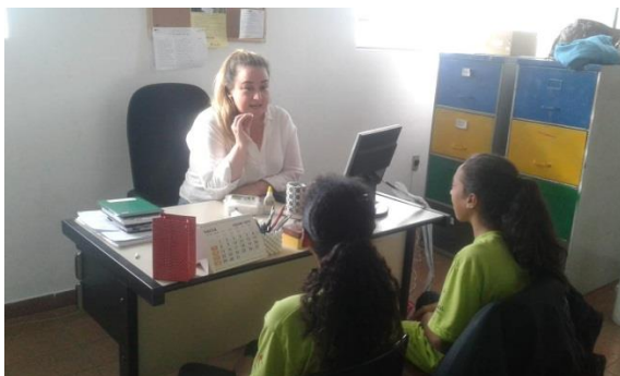
Fig.01 mediação de conflito 04/07/19