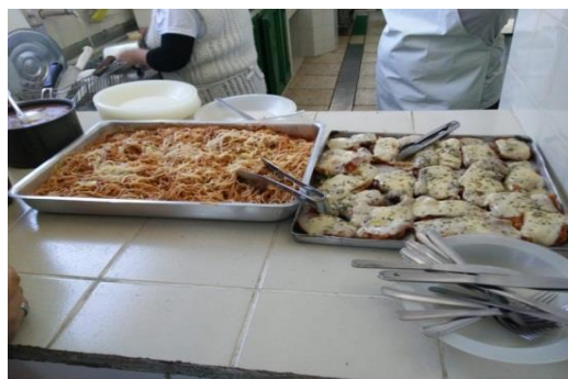
Fig.02 Lanche 12/07/19