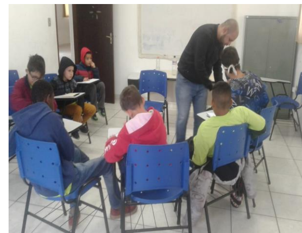
Fig. 05 oficina de música: 19/08/19