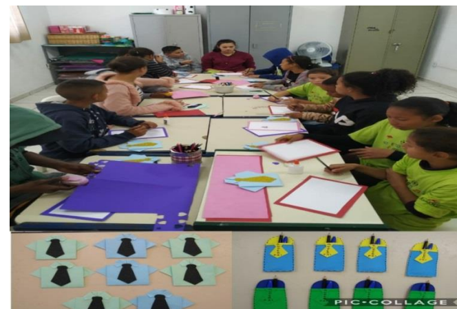
Fig.02 oficina de artes: confec. cartão e convite dia dos pais.