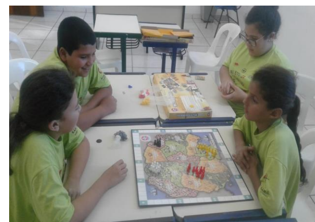
Fig. 08 jogos recreativos 29/08/19