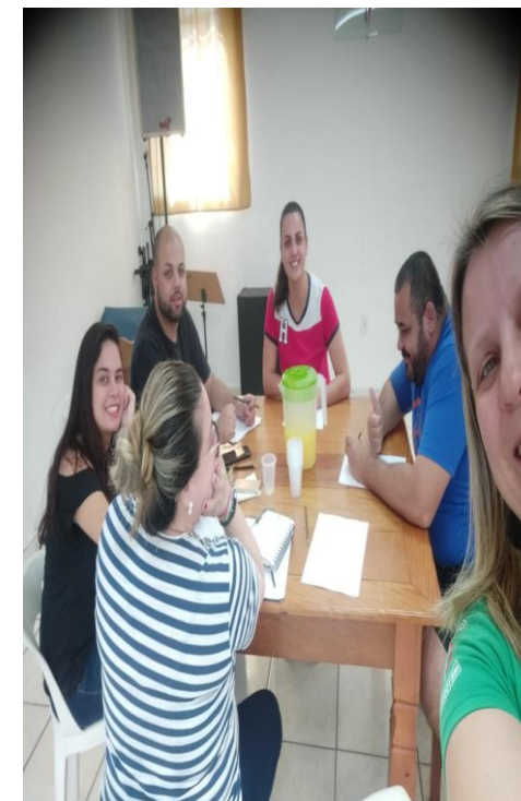
Fig. 08 reunião equipe técnica 05/08/19

Obs.: A meta 02 será realizada no segundo semestre.