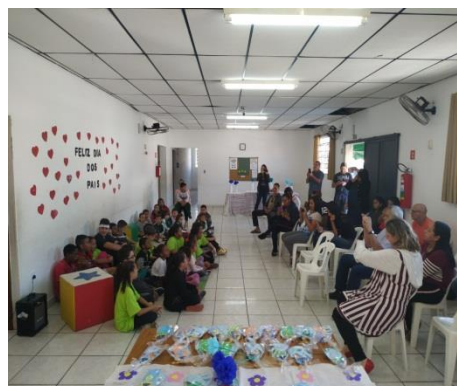
Festividade do dia dos pais: 09/08/19