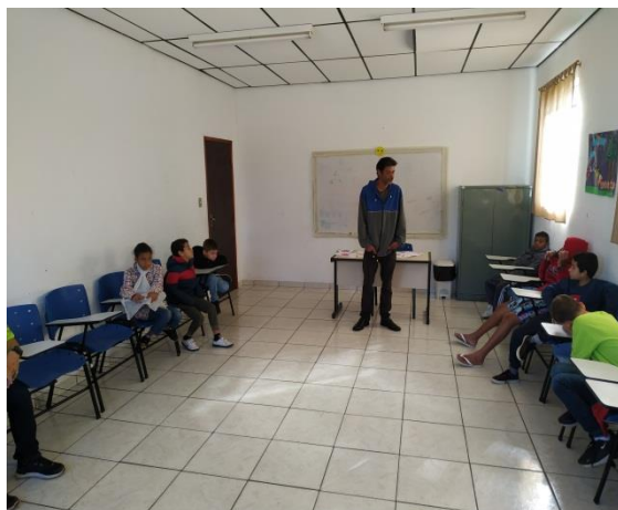
Fig. 04 oficina de inglês 12/08/19