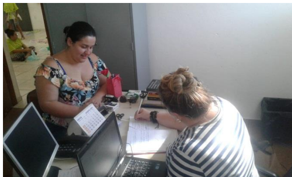
Fig.01 inserção usuário 01/08/19