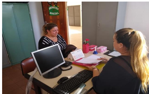
Fig.02 encaminhamento NIS 02/08/19