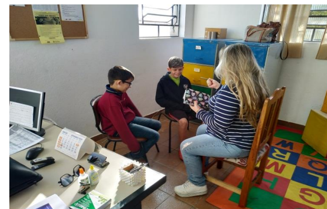
Fig.05 Mediação conflito 23/08/19