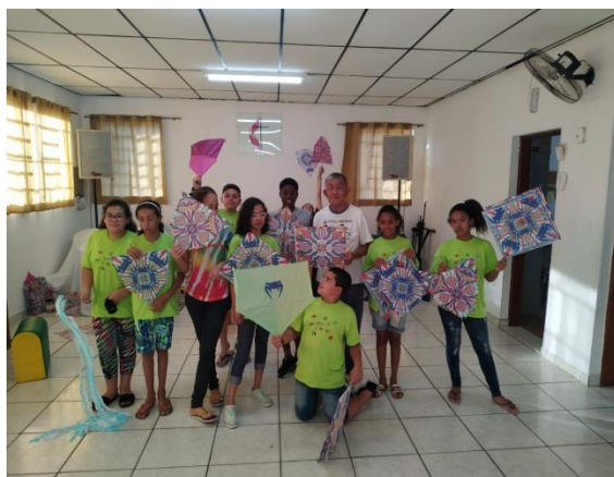
Fig.06 oficina de música: 28/08/19