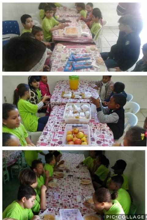
Fig.06 lanches Agosto 2019