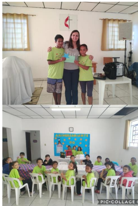
Fig.07 Aniversariante e Destaque mês