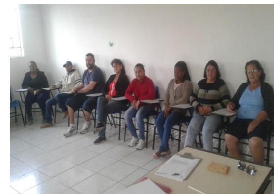
Reunião de Pais dia 15/08/19