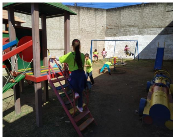
Fig. 07 lazer 23/08/19