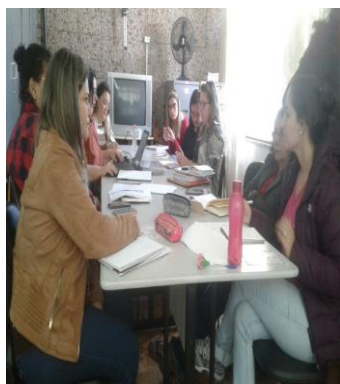
Fig.01 reunião CMDCA 02/08/19