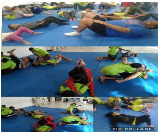
Fig.03 oficina esportes: jiu-jitsu 20/08/19