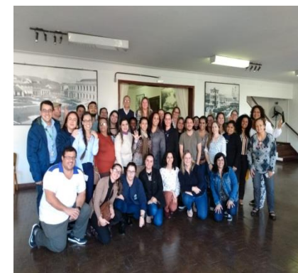
Fig.04 workshop 16 e 23 de Agosto