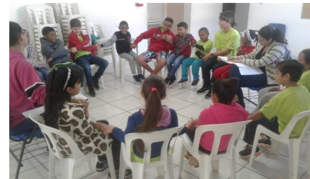
Fig.03 acolhimento diário 12/08/19