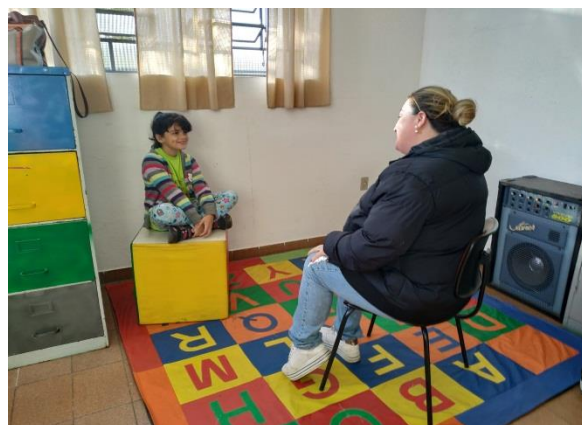
Fig.04 Escuta individualizada 18/08/19