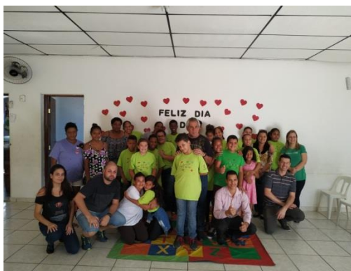
Festa do dia dos pais: 09/08/19