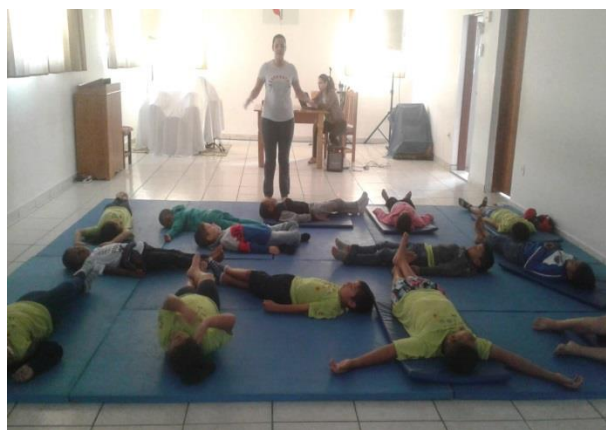
Fig.01 alongamento consciente 05/08/19 Psicossocial

perspectiva, ao se falar em jogos, geralmente, faz-se associação a um divertimento, brincadeira e passatempo que existe regras a serem observadas durante a realização dessas atividades, contudo sabe-se que o jogo é um processo lúdico e criativo que possibilita aos educandos modificar imaginariamente a realidade, pois funciona como elo integrador entre os três domínios do conhecimento que são primordiais para o desenvolvimento psicomotor, cognitivo e o afetivo-social. Com tudo isso fortalecendo o Eixo Convivência Social , aspectos ligados ao sentimento de pertença, capacidade de comunicar-se e a formação de identidade. Realizado 2 vezes por semana.