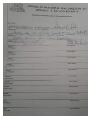
Fig.02 Lista de chamada CMDCA 02/08/19