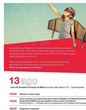
Fig.03 reunião ODSs 13/08/19