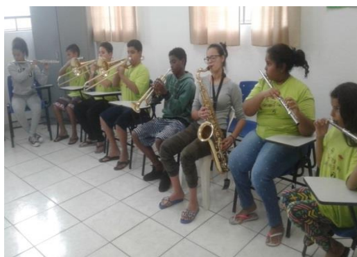
Fig.09 Oficina de Música 16/09