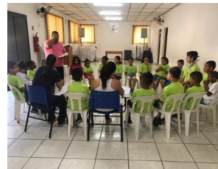
Fig.03 Acolhimento diário 02/09