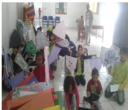
Fig.05 Oficina de Pipa 26/09