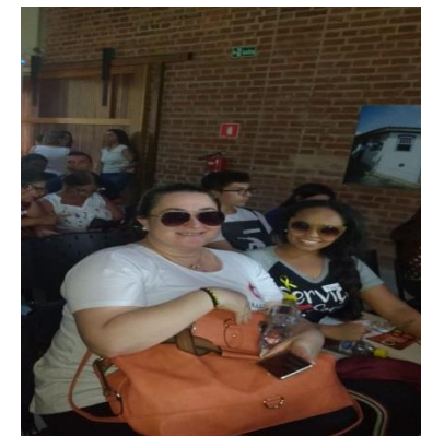
Fig.04 XII Conferência de Assistência Social