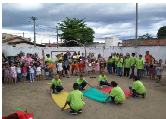
Fig. 02 Apresentação de Dança Festa da Primavera 2019.