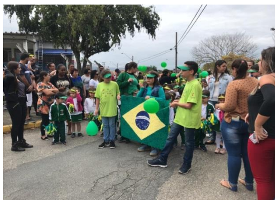
Fig.01 Atividade Cívica com a participação dos pais/familiares