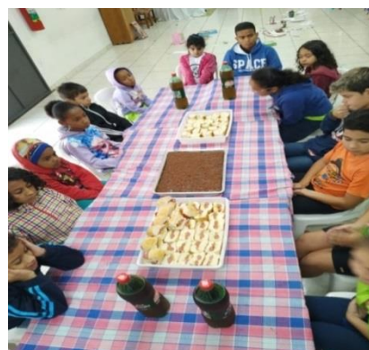
Fig.09 Aniversariante do Mês 26/09