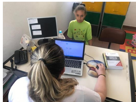
Fig.06 Acomp. individual 26/09