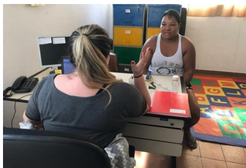
Fig.01 Encaminhamento Nis 05/09