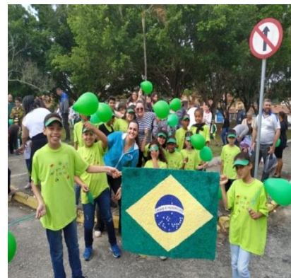
Fig.03 Ato Cívico 06/09/19