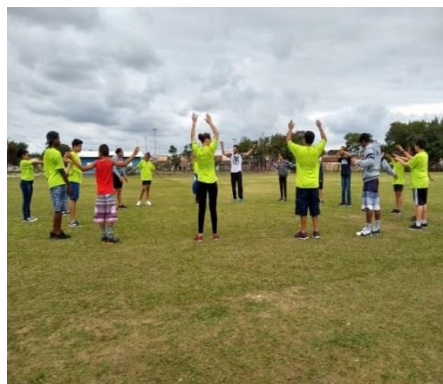
Fig.02 Atletismo 12/09