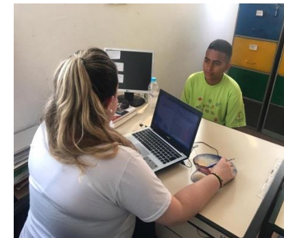
Fig.04 Escuta individualizada 18/09