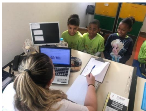
Fig.05 Mediação de conflitos 26/09