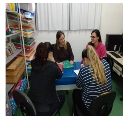
Fig.10 Reunião de Equipe 03/09