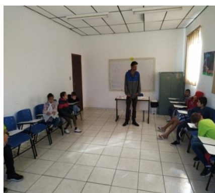
Fig.06 Oficina olhando para o futuro 30/09