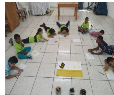
Fig.08 Dinâmica Psic, Setembro Amarelo 11/09