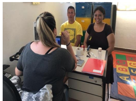
Fig.02 Atendimento Familiar 17/09