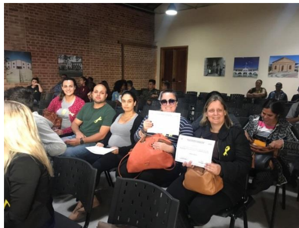
Fig. 01 Capacitação equipe Sasimg Setembro Amarelo 23/09