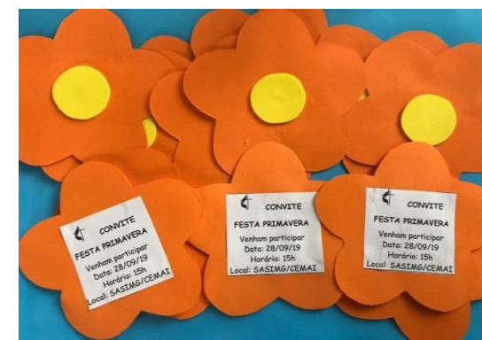
Fig.11 Oficina de Artes ;convites confeccionados pelos usuários Festa Primavera