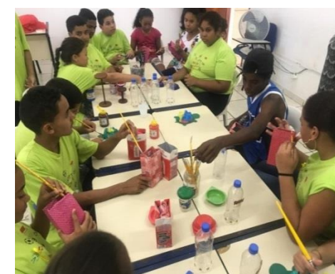
Fig.04 Oficina de Artes 09/09