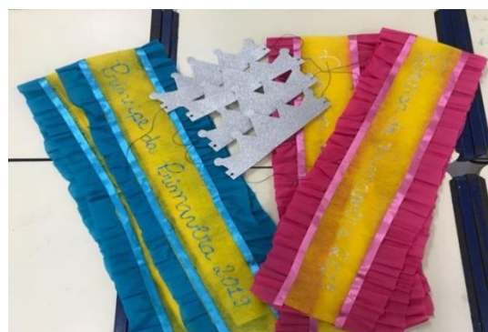
Fig.10 Oficina de Artes :faixa da princesa e príncipe da Primavera 2019