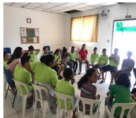
Fig.07 Roda de conversa Setembro Amarelo 20/09