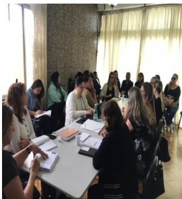
Fig. 01 Reunião CMDCA 05/09/19