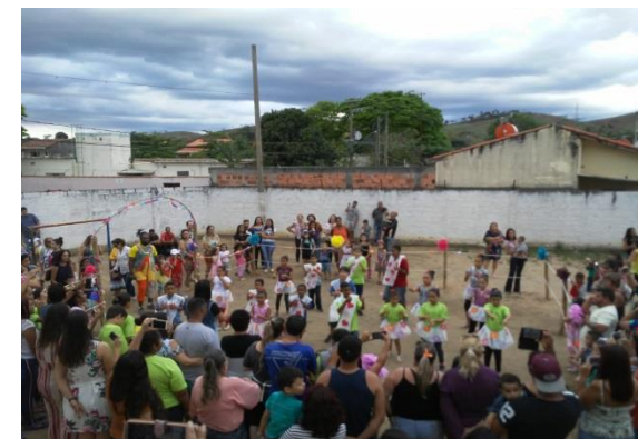
Fig. 03 Participação dos Pais e Familiares comunidade