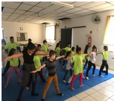
Fig.01 Along. Consciente Psicossocial 16/09