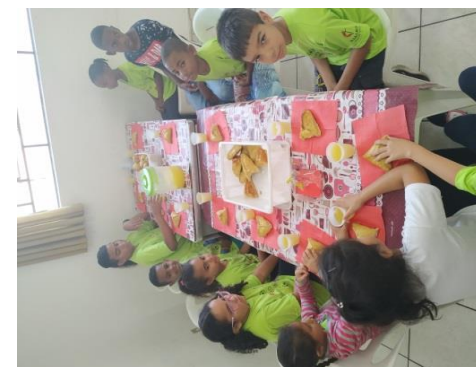
Fig.07 Lanche 27/09