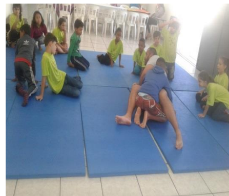
Fig.03 Jiu-Jitsu 17/09