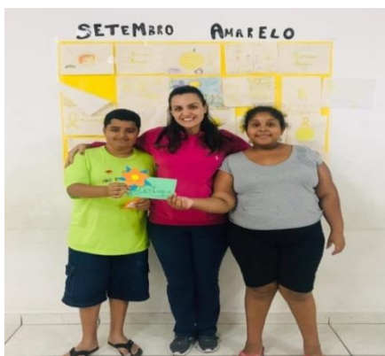
Fig.08 Destaque do Mês 26/09