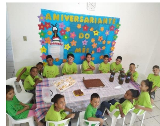
Aniversariante do Mês 30/10/19