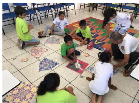
Oficina de Pipa: 30/10/19