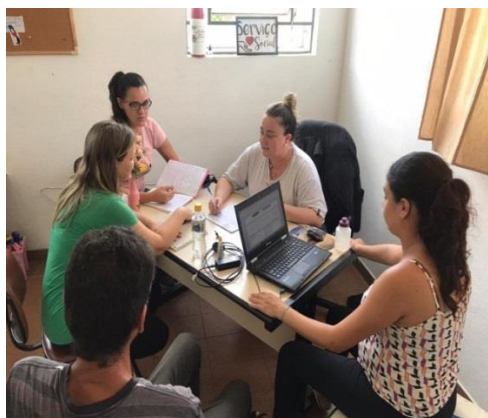
Reunião de Equipe Mensal 04/10/19