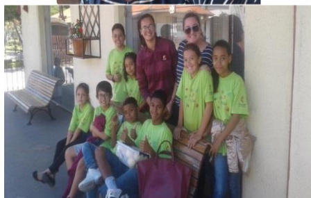
Passeio Distaque do mês Trenzinho Em Pindamonhangaba: 01/10/2019