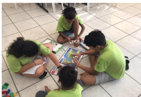
Lazer e jogos recreativos: 25/10/19