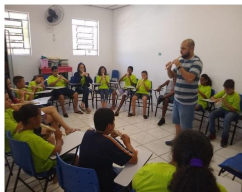
Oficina de música: 28/10/19