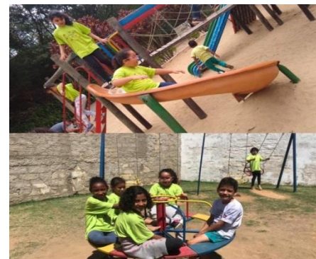
Lazer dia: 14/10/19