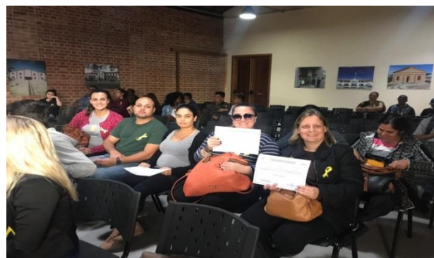
Fig. 01 Capacitação equipe Sasimg Setembro Amarelo 23/09