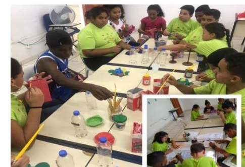
Oficina de Artes: 09/10/19