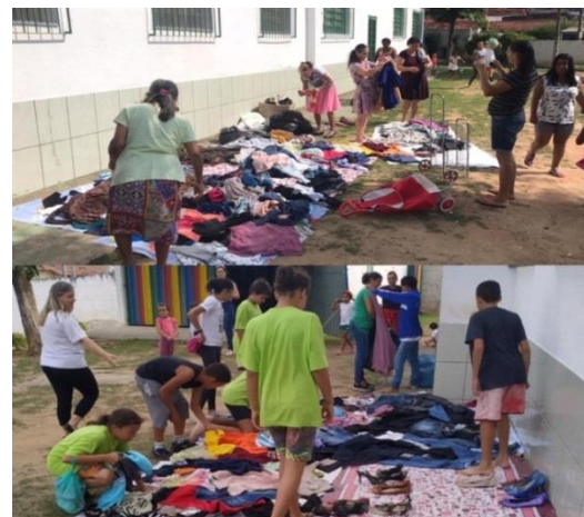
Ação: Bazar Solidário com os Pais: 18/10/19