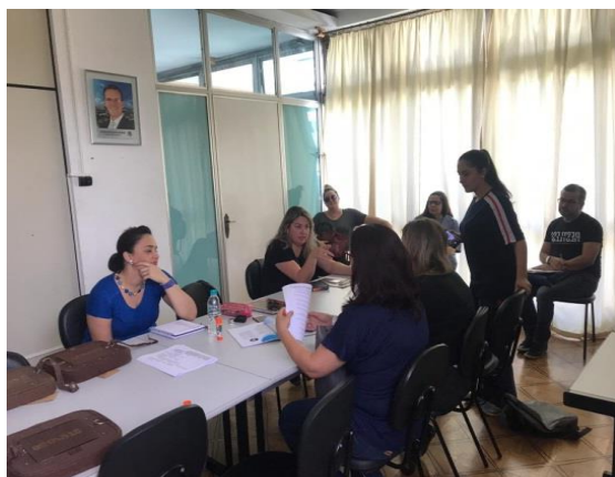
Reunião CMDCA: 03/10/19