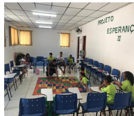
Oficina Olhando para o Futuro: 23/10/19