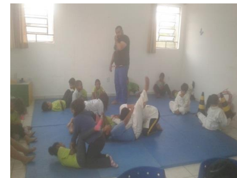
Of. de Esportes: Aula de Jiu-Jitsu 18/10/19