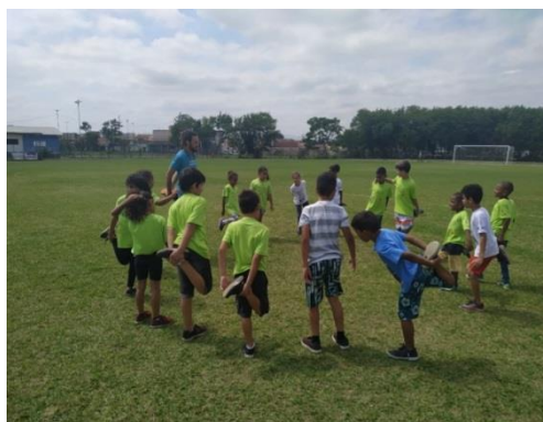
Oficina de Esportes; Atletismo: 10/10/19