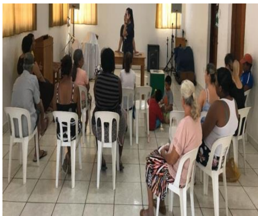
Reunião de Pais: 18/10/19