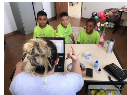
Mediação de Conflito 30/10/19