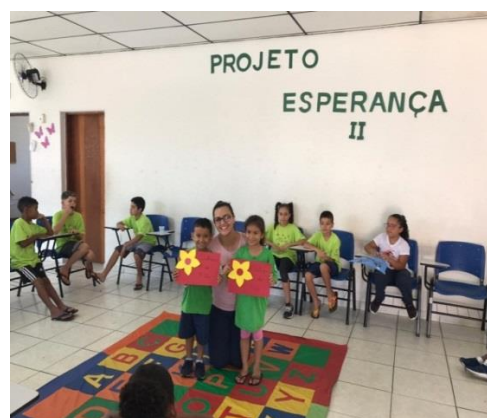
Destaque do Mês de Outubro 30/10/19