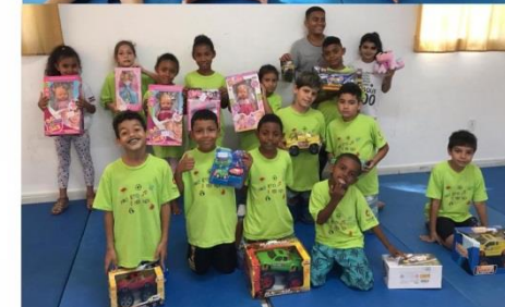
Entrega de Presente: 11/10/2019