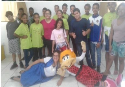
Festividade dia das crianças: 10/10/2019