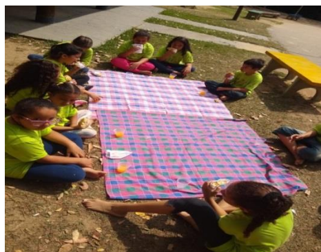
Lazer: Pic-Nic 15/10/19