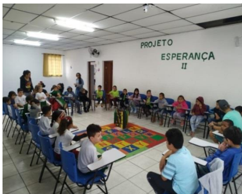
Acolhimento diário 17/10/19