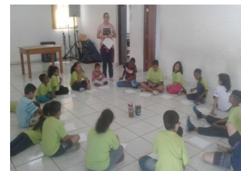
Dinâmica O que você quer ser quando crescer? Psicossocia: 08/10/19