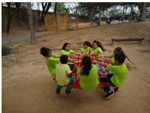
Lazer: Passeio parque ecológico: 15/10/19