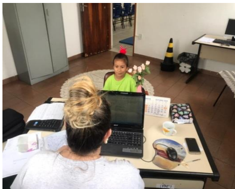
Atendimento individual 29/10/19