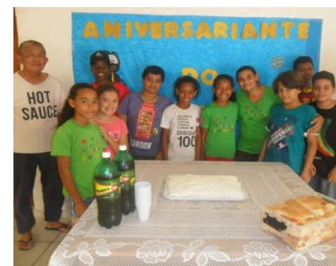
Aniversariante do mês de novembro 28/11/19