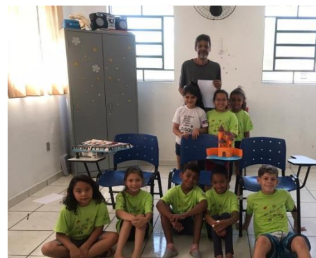
Oficina Olhando para o Futuro 06/11/19