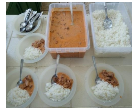
Almoço dia 21/11/19