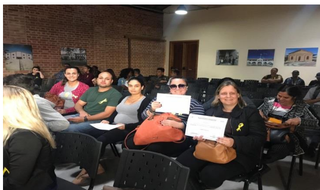
Fig. 01 Capacitação equipe Sasimg Setembro Amarelo 23/09