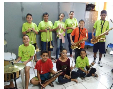
Oficina de Música 18/11/19