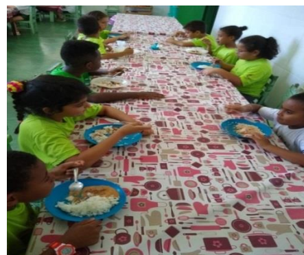
Almoço 2 vezes ao mês 21/11/19