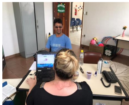
Encaminhamento para o NIS 01/11/19