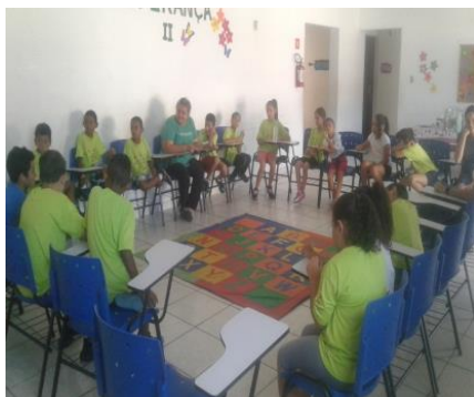
Acolhimento diário 01/19/19