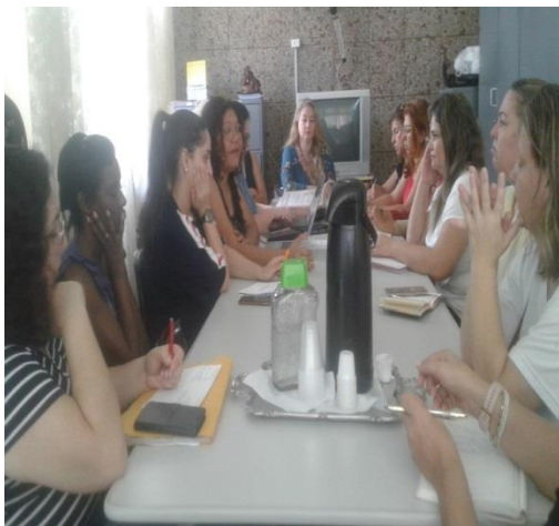
Reunião CMDCA 13/11/19