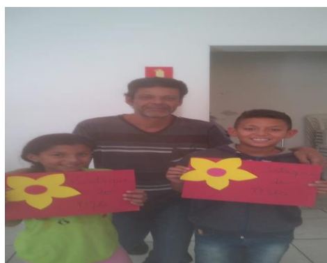
Destaque do mês 28/11/19