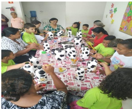
Atividades Fortalecimento Vinculos 20/11/19