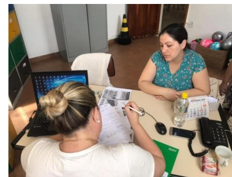
Inserção de usuários 04/11/19