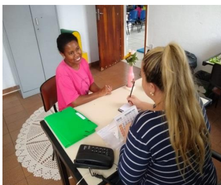
Desligamento de usuário 01/11/19