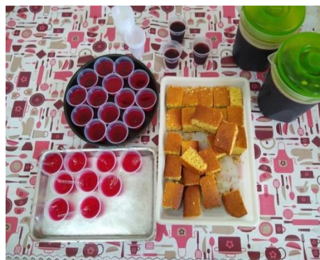
Lanche diário 14/11/19