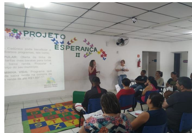
Palestra com os pais sobre Cad.Único 06/11/19