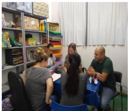
Reunião de equipe 05/11/19