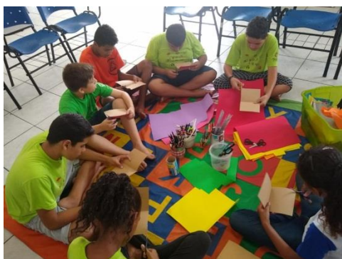
Oficina de Arte 12/11/19