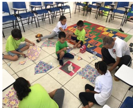
Oficina de Pipa 27/11/19