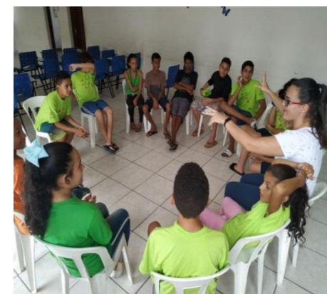
Dinâmica psicossocial 13/12/19