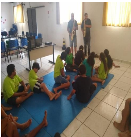
Oficina de música 02/12/19