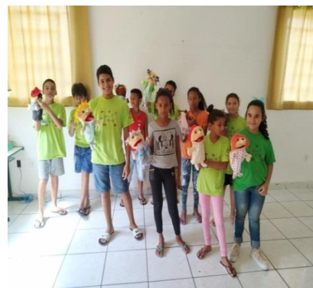
Oficina de Artes- teatro 03/12/19