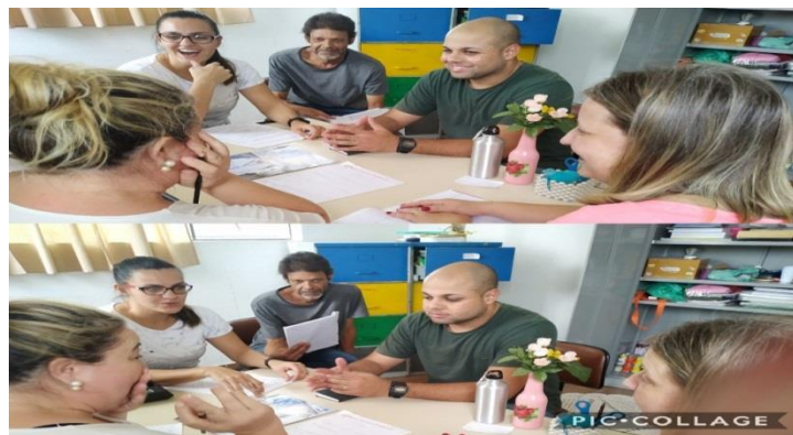
Reunião de equipe dia 02/12/19