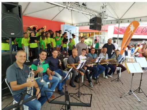
Cantata Participa Guará