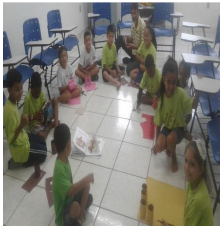
Oficina Olhando p/Futuro 04/12/19