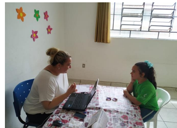
Escuta individualizada 04/12/19