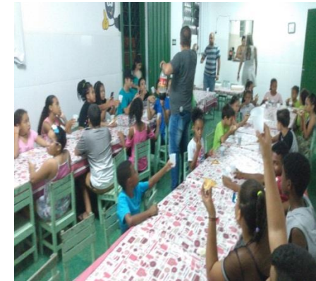
Presença da DISE 02/12/19