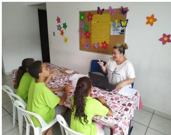
Mediação de conflitos 04/12/19