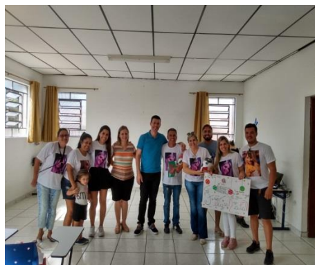
Festa de Encerramento e Apadrinhamento 2019