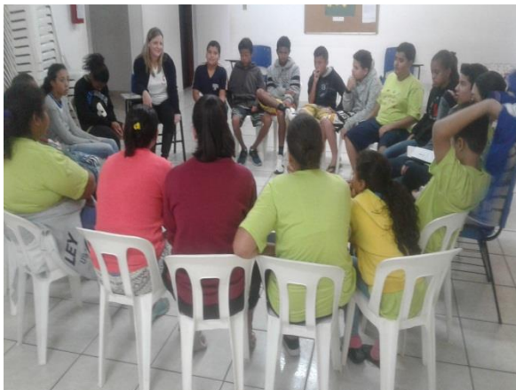
Acolhimento diário 05/12/19