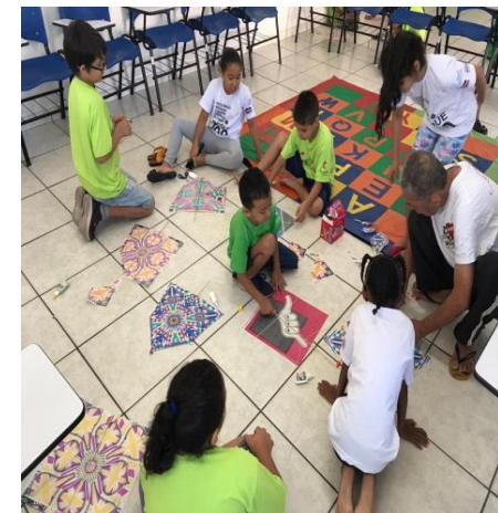
Oficina de Pipa 18/12/19