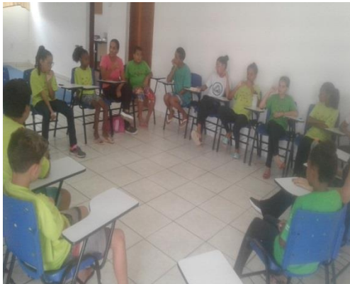
Acolhimento diário 07/02/202