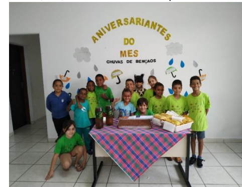
Aniversariante do mês 28/02/2020