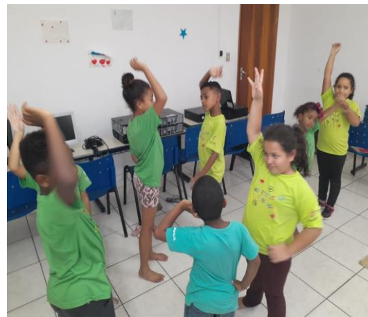
Oficina de Artes:conscientização corporal 03/02/20