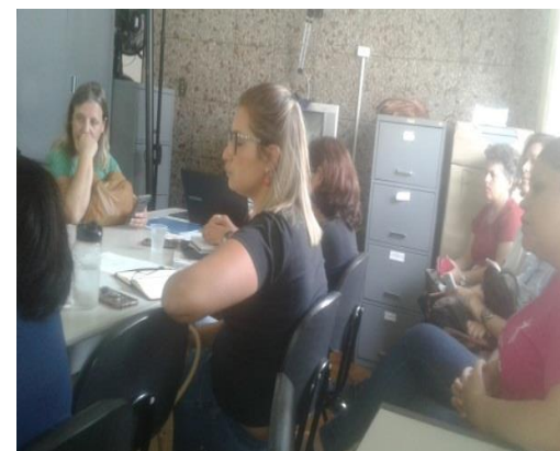
Reunião do CMDCA