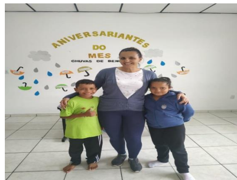
Destaque do mês 28/02/2020