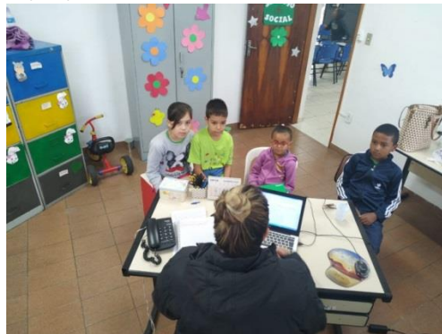
Mediação de conflitos 21/02/2020