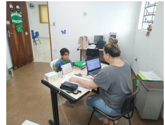
Acompanhamento individual 04/02/2020