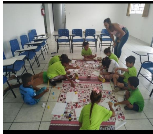
Psicossocial: Dinâmica 07/02/2020