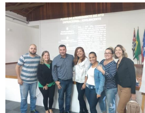
Capacitação dia 12/02/2020