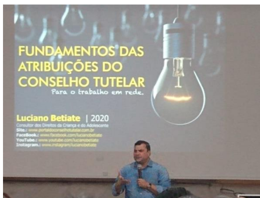
Capacitação dia 11/02/2020