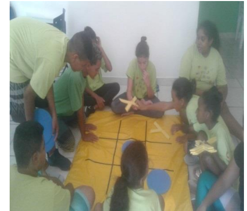
Jogos educativos 26/02/2020