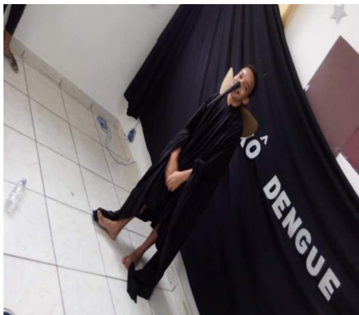
Oficina de Artes :Teatro Xô Dengue!! 21/02/2020