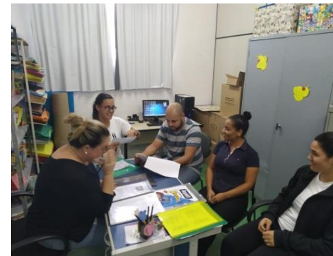
Reunião de equipe