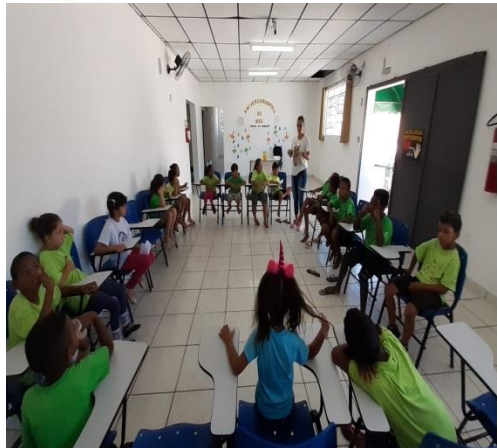
Psicossocial: Roda de conversa 19/02/2020

Lazer e Jogos Recreativos: Correr, pular corda, desenhar, jogar queimada, bandeirinha, brincar de roda, dança da cadeira, jogos lúdicos, vôlei, etc., são atividades que fazem parte da infância da maioria das crianças e adolescentes promovendo o desenvolvimento do Eixo Direito de Ser e do Eixo Participação outras atividades. Com tudo isso fortalecendo o Eixo Convivência Social , aspectos ligados ao sentimento de pertença, capacidade de comunicar se e a formação de identidade. Realizado 2 vezes por semana.