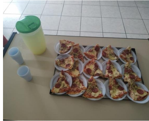
Lanche dia 19/02/2020