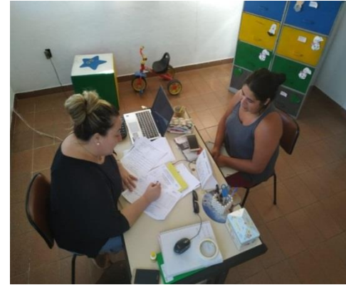
Inserção dia 17/02/2020 05/02/2020