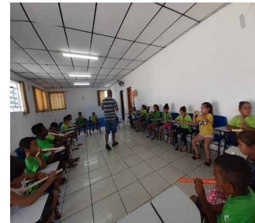
Oficina de Música 10/02/2020