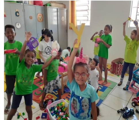
Brinquedoteca: Lazer 10/02/2020