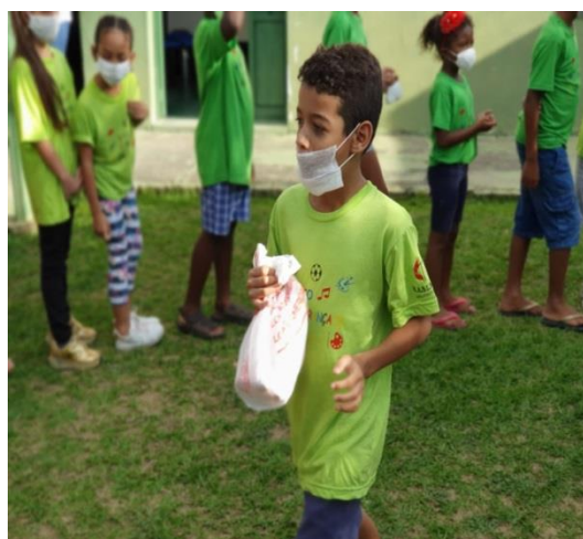
Entrega de ovos de páscoa 08/04/2020