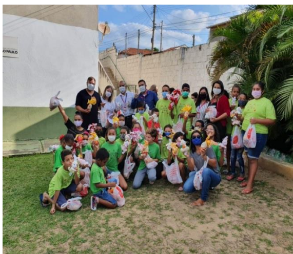
Entrega de ovos de páscoa 08/04/2020