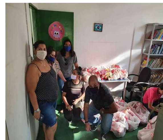
Entrega de ovos de páscoa 08/04/2020