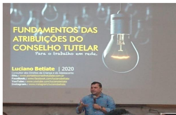
Capacitação dia 11 e 12 fevereiro