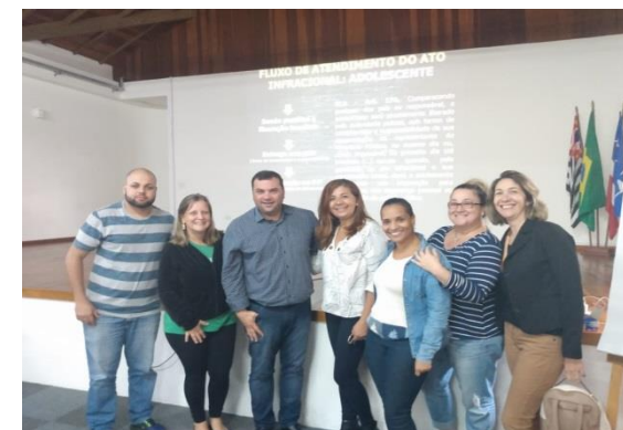
Capacitação dia 11 e 12 fevereiro