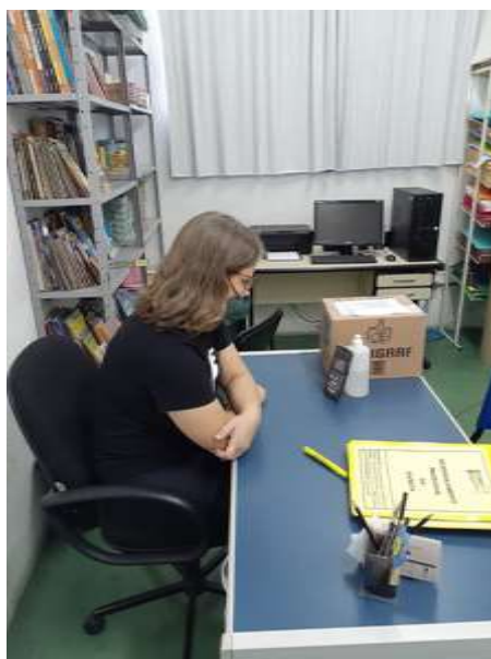
REUNIÃO CMDCA 02/12/2021