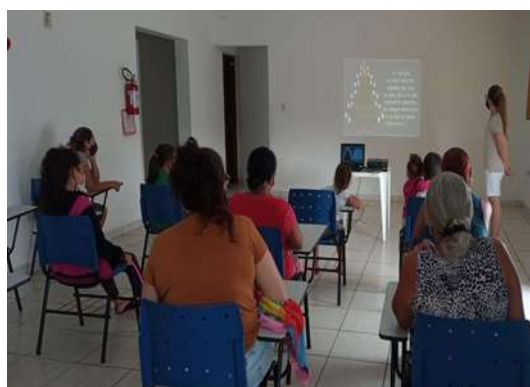
Reunião Socioeducativa 17/12/2021