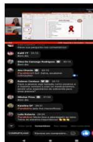
LIVE DEZEMBRO VERMELHO 06/12/21