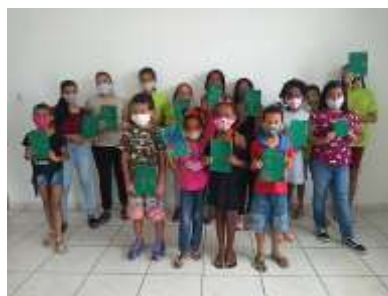
CARTÃO DE NATAL