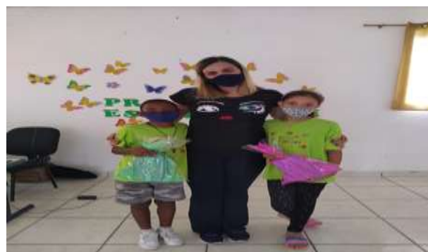
DESTAQUES DO MÊS