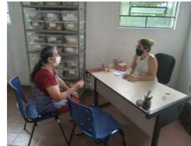
Alguns dos atendimentos de Dezembro 2021