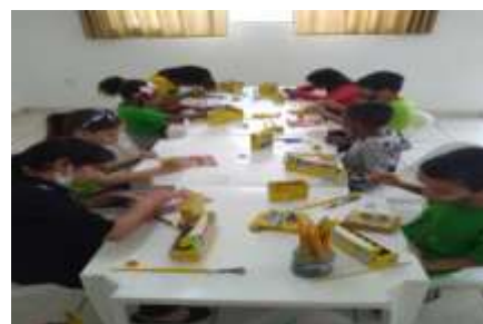
OFICINA DE ARTES