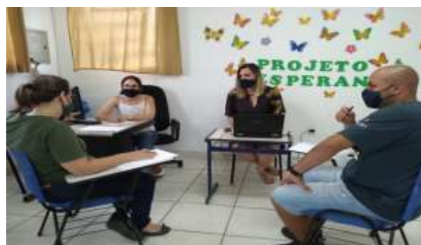
REUNIÃO DE EQUIPE 19/12/2021