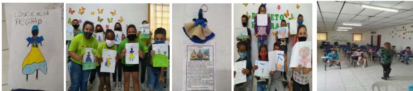
CARTAZ CONSCIÊNCIA NEGRA 19/11/2021