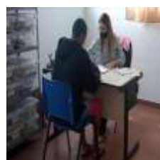
Alguns dos atendimentos de Novembro 2021