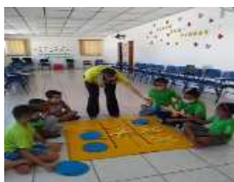
LAZER E JOGOS