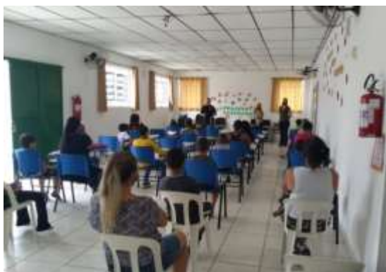
Reunião Socioeducativa 08/11/2021