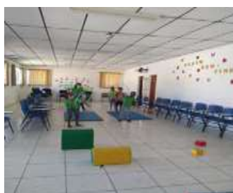
LAZER E JOGOS