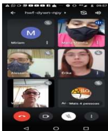
Reunião CMAS 09/11/2021