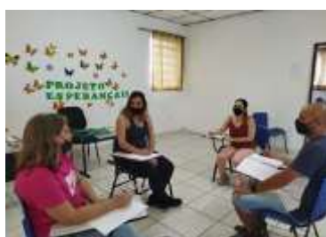
REUNIÃO DE EQUIPE 26/11/2021