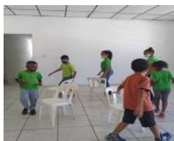
LAZER E JOGOS