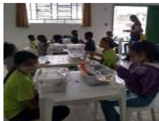
OFICINA DE ARTES