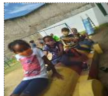
Lazer e jogos 13/02/22