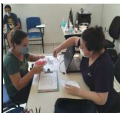
Atend. Individual 08/02/22