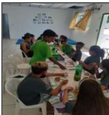
Aniv. Mês 25/02/22