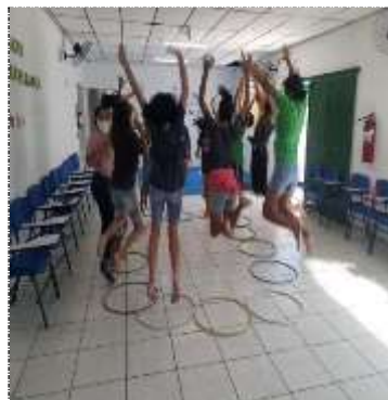
Of. lazer e jogos 23/02/22