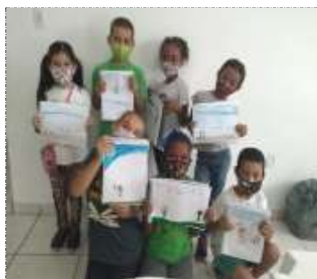
Of. psicossocial 14/02/22