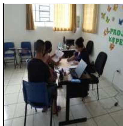
Inserção de usuário 15/02/2