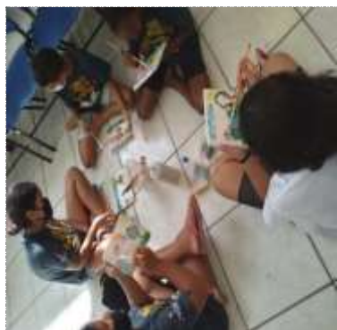
Of. artes 07/02/22