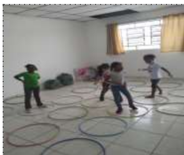
Of. lazer e jogos 09/02/22