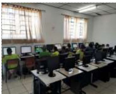
Of. conecta informática 23/02/22