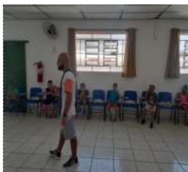
Of. música 20/02/22( flauta doce )