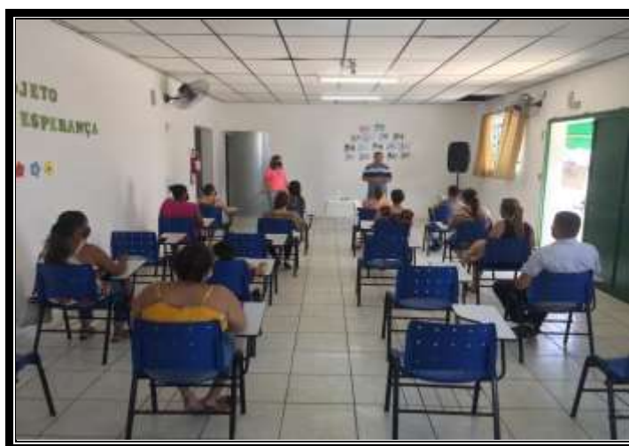
Reunião socioeducativa 23/02/22