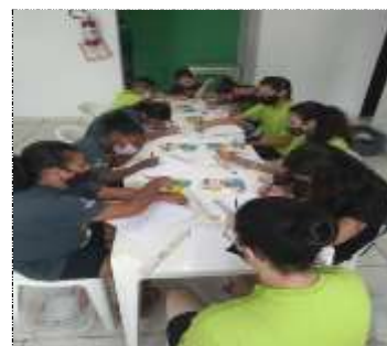
Of. artes/massa de modelar 21/02/22