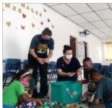
Of.lazer e jogos