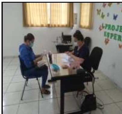
Inserção de usuário 08/02/2022