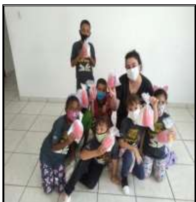
Entrega do kit biossegurança