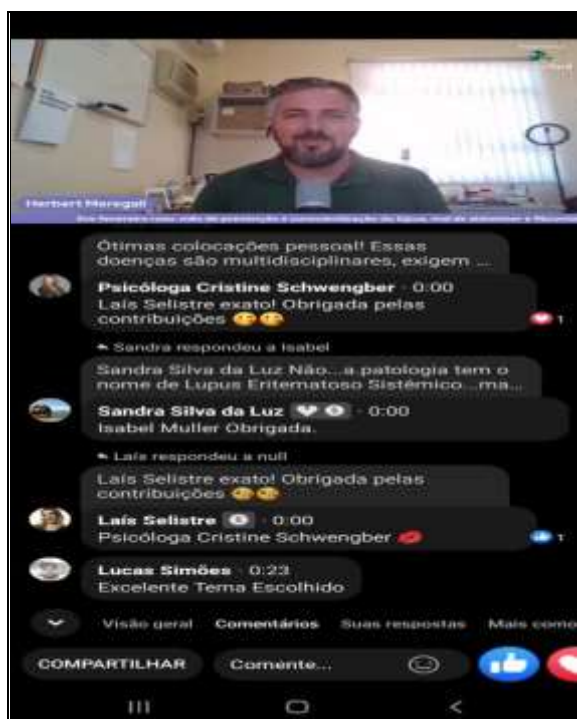
18/02/22 fevereiro roxo

O objetivo da capacitação é o desenvolvimento profissional e pessoal da equipe de colaboradores do projeto. Desse modo, os funcionários capacitados tendem a adquirir novas habilidades e melhorar seu desempenho em suas funções.