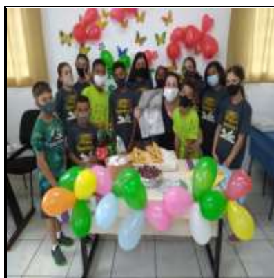
Aniv. Mês 25/02/22