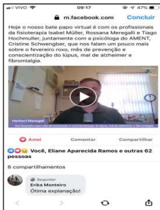
18/02/22 fevereiro roxo