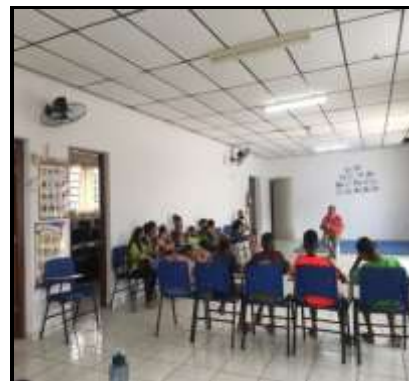
Acolhimento diário 01/02/22