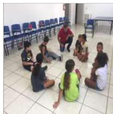
Integração com usuários 25/03/22