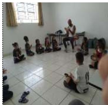
Of. esportes/capoeira 28/03/22