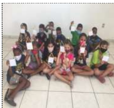
Of. artes 08/03/22 (Dia da mulher)