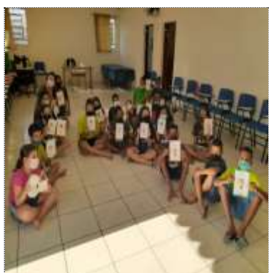
Of. artes dia das mulheres 08/03/22