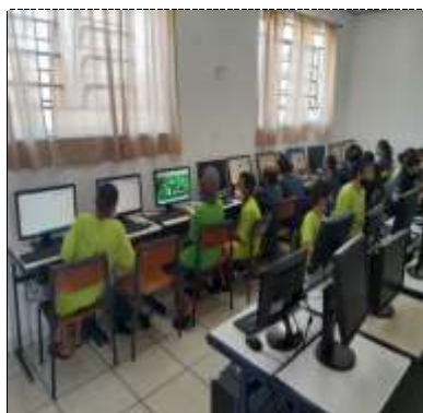
Of. informática Conecta 02/03/22