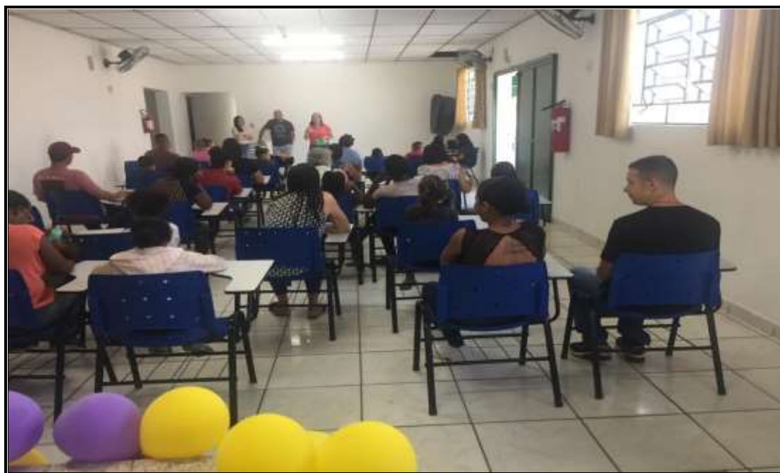
Reunião Socioeducativa 29/03/22