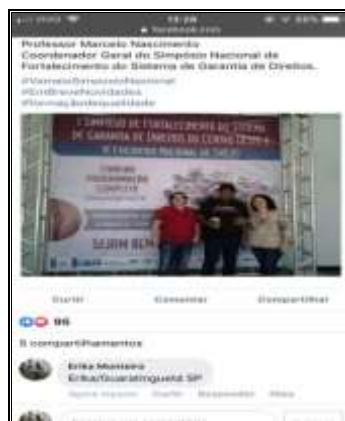
capacitação online 15/03/22