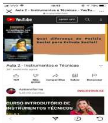
Capacitação online 13/03/22