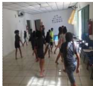
Of. esportes/capoeira 31/03/22