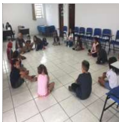
Of. psicossocial/debate Dia da Água