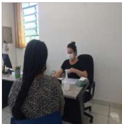
Inserção Usuário 16/03/22