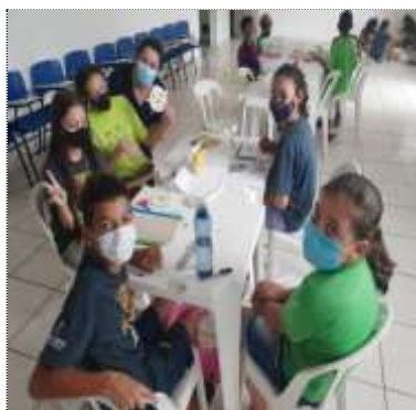
Of. psicossocial 24/03/22