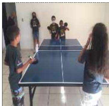
Of. lazer e jogos 25/03/22