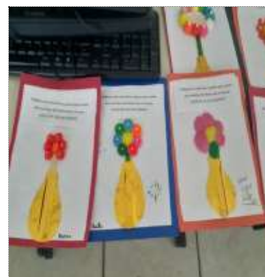
Of. artes 08/03/22