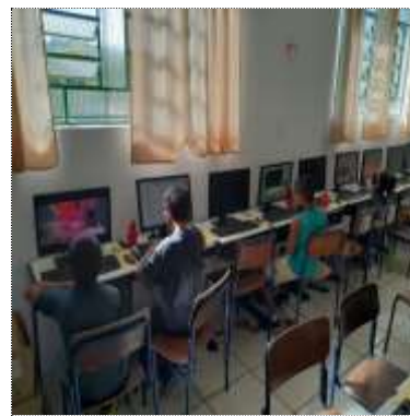
Of. Informática Conecta 11/03/22