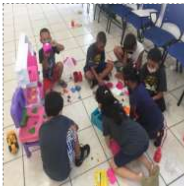
Of. lazer e jogos 15/03/22