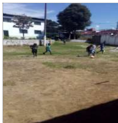
Of. esportes 29/03/22