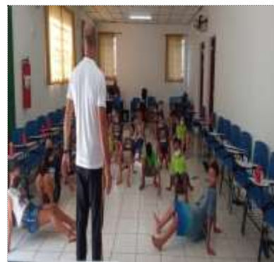
Of. esporte/capoeira 21/03/22