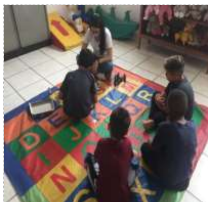
Of. psicossocial 30/03/22