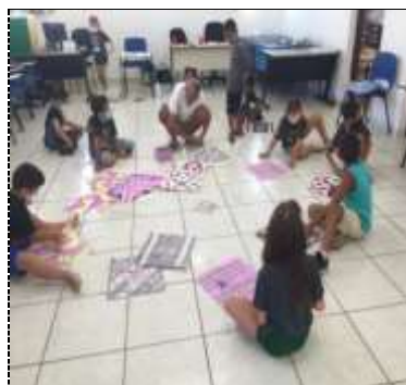
Of. artes/pipa 17/03/22