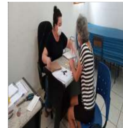
Encaminhamento CAPS 11/03/22