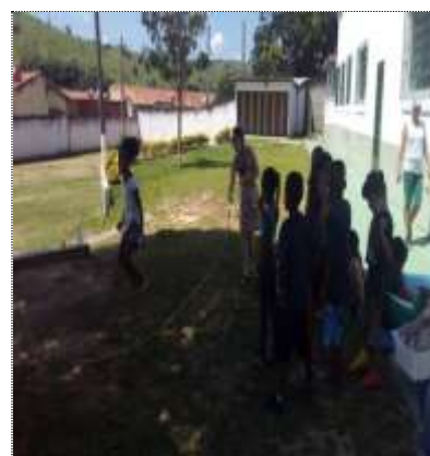
Of. lazer e jogos 02/03/22