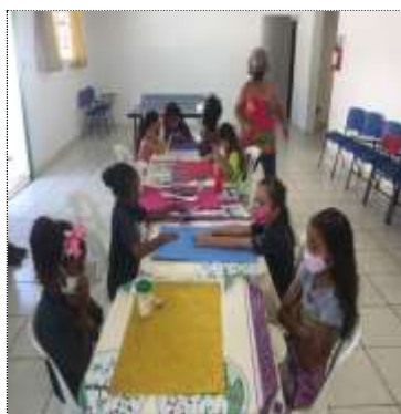
Of. artes 18/03/22