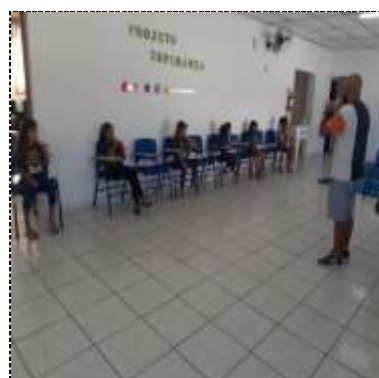
Of. música 24/03/22