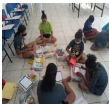
Of. psicossocial 04/03/22