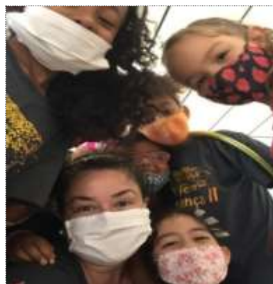
Integração com usuários