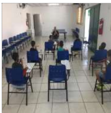
Of. música 25/03/22