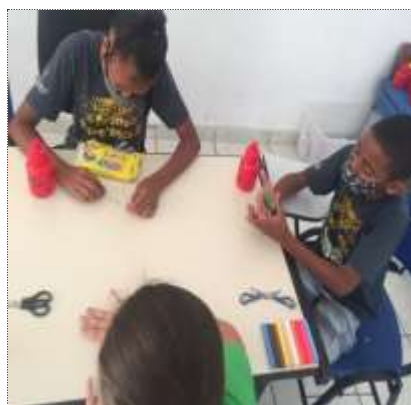
Of. artes 25/03/22