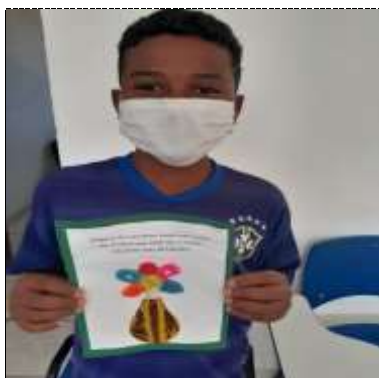
Of. artes 24/03/22