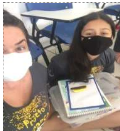
Atend. Individualizado 17/03/22