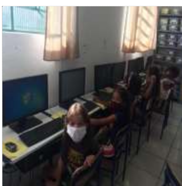
Of. Informática conecta 29/03/22