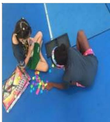
Of. lazer e jogos