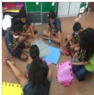
Of. artes 18/03/22