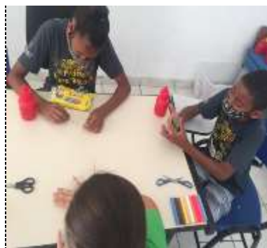
Of. artes/massa modelar