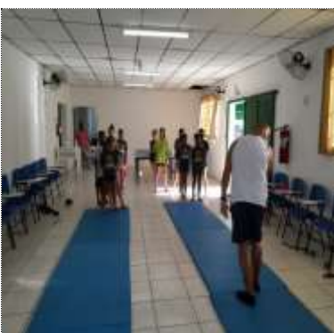
Of. esportes/ativ. motora 14/03/22