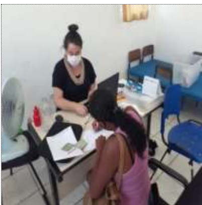
Inserção de usuário 03/03/22