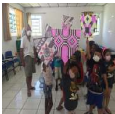
Of. artes/pipa 17/03/22