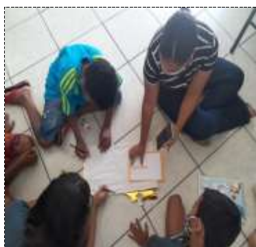
Of. artes 24/03/22