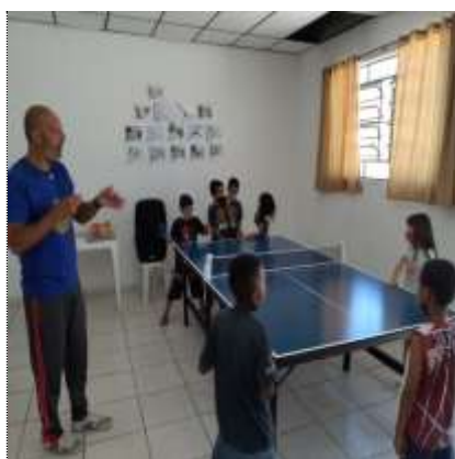
Of. lazer e jogos 30/03/22