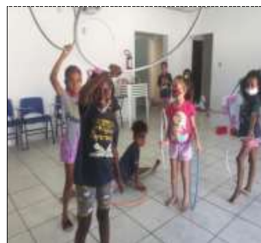
Of. lazer e jogos 28/03/22