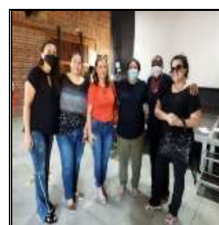
Capacitação DISIA 24/03/22