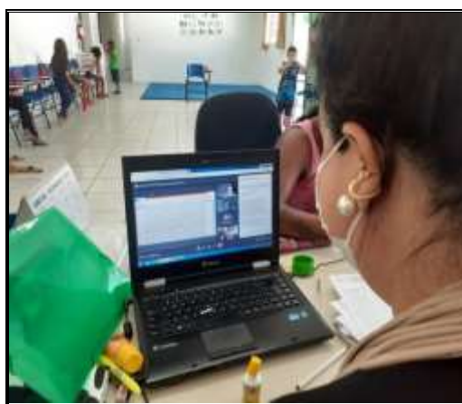
Reunião CMAS 22/03/22