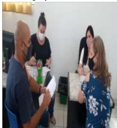
Reunião Técnica 16/03/22