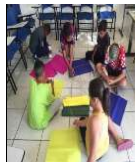
Confecção pipa 26/08/22