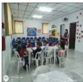
Jogo cartas e reciprocidade 23/08/22