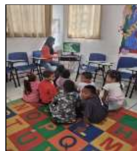
Filme "O Reino da Amizade" 11/08/22