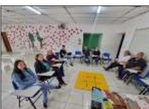
Reunião de Equipe 09/08/22