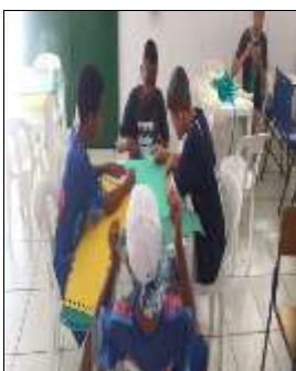
Conf. cartazes 31/08/22