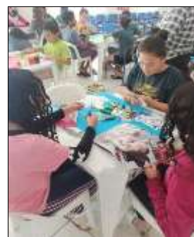
Com. cartaz Agosto Lilás 17/08/22