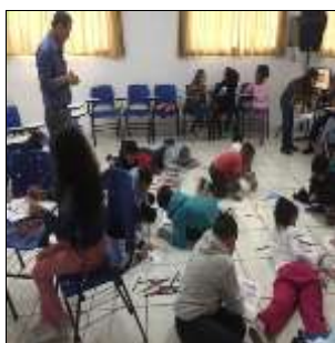
Desenho do filme "A Cigarra e a Formiga" 04/08/22