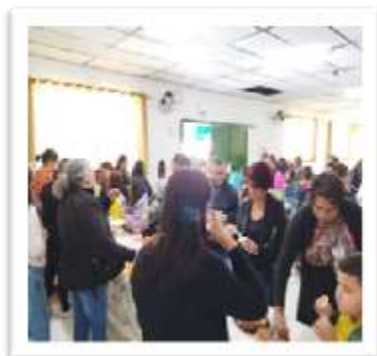
Comemoração ao Dia dos Pais - 12/08/22

Observações: Atingimos um número significativo de participação dos pais/familiares na reunião socioeducativa.