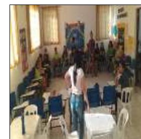
Debate "Valores Humanos" 16/08/22