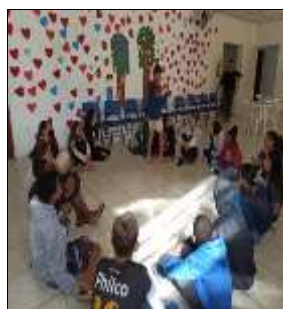
Roda conversa "A Justiça" 09/08/22