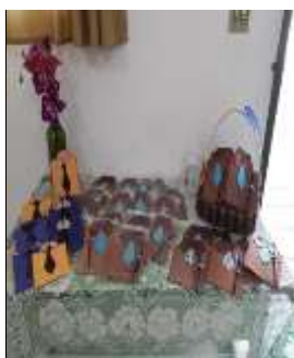
Lembrança Dia dos Pais 12/08/22