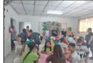
Aniversariante mês 26/08/22