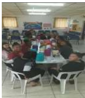
Pintura reciclagem 24/08/22