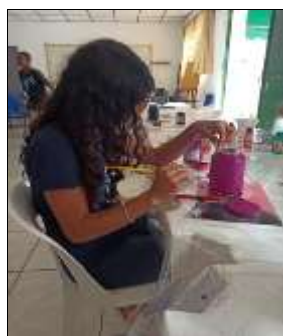
Pintura em vidro 10/08/22