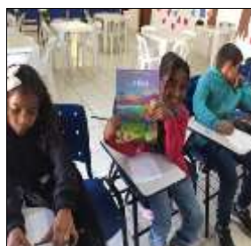
Leitura "A Justiça" 15/08/22