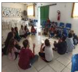
Ativ. autocuidado 01/08/22