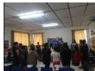
Acolhimento diário 25/08/22