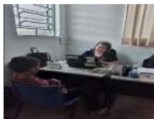
At. usuário 19/08/22