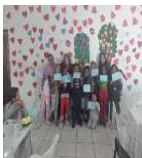
Roda conversa 08/08/22