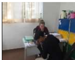
At. familiar 08/08/22