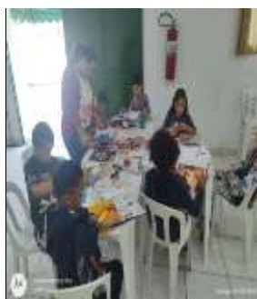
Ativ. com recortes Agosto Lilás 20/08/22