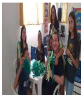
Co. pompom 03/08/22