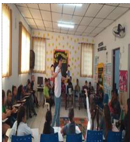
Acolhimento diário 28/09/22