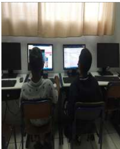
19/09/22 Oficina conecta de informática 26/09/22