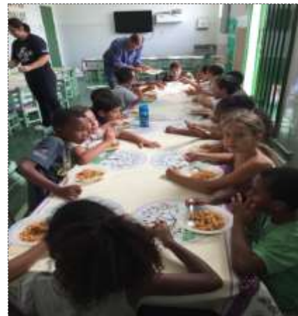
Lanche diário 27/09/22