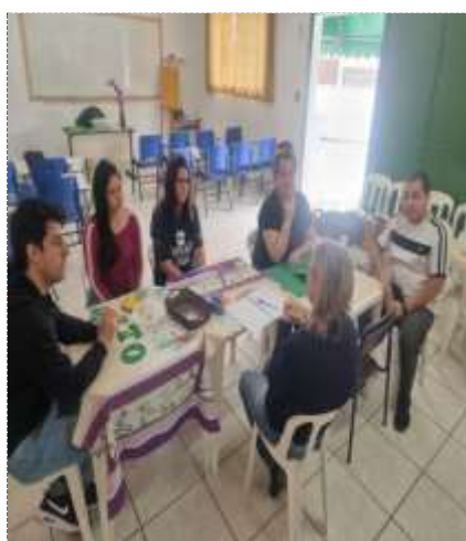
Reunião equipe técnica 06/09/22