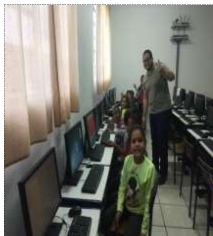
Oficina de informática 12/09/22