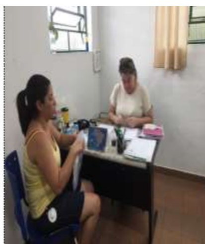
Inserção de usuário 22/09/22