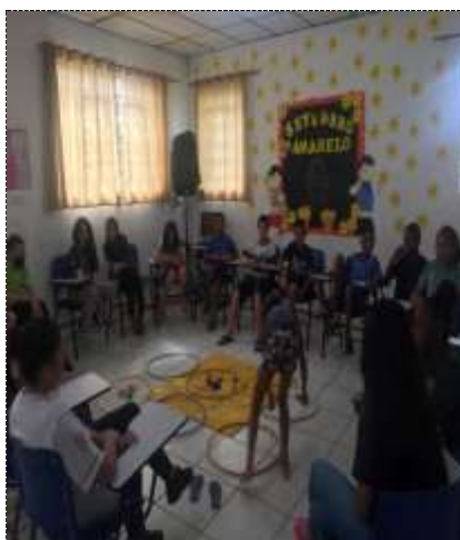
Dinâmica do bambolê 22/09/22