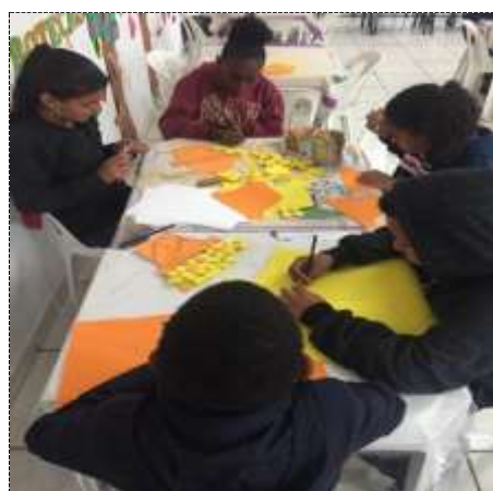
Conf. vasilhinhos EVA