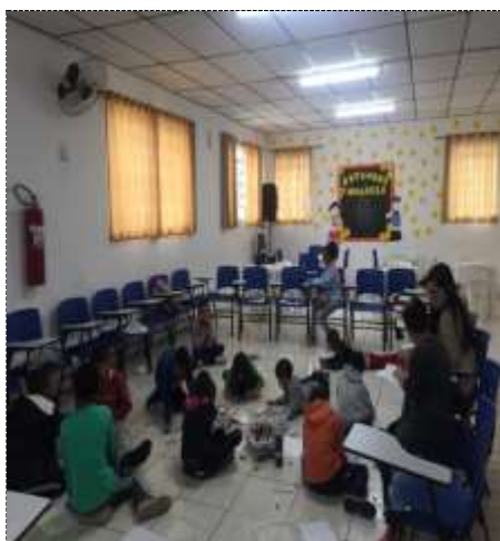
Desenho setembro amarelo 29/09/22