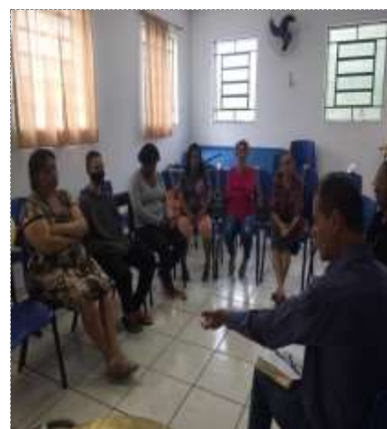
PAF-Programa de Atendimento a Família 21/09/22