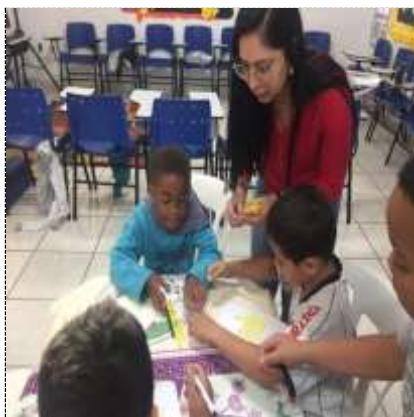
Conf. Letras painel-02/09/22