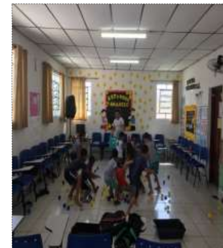
Dinâmica das bolas 26/09/22