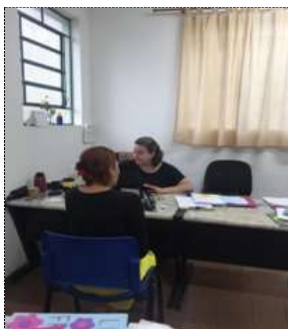
Orientação sobre bolsa Brasil 19/09/22