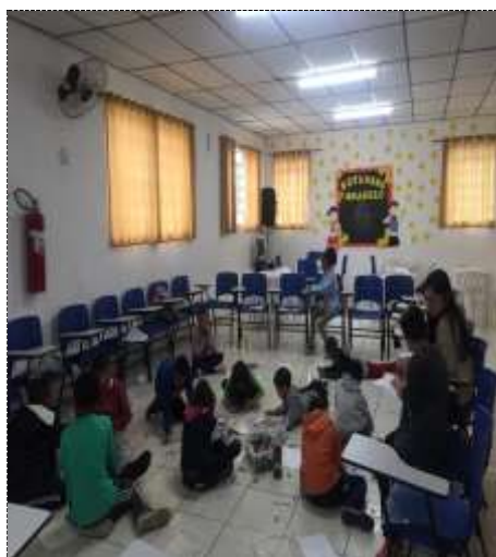
Desenho dos sentimentos 05/09/22