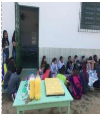
Lanche diário 14/09/22