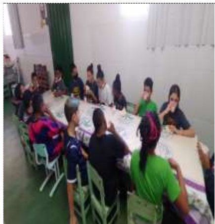
Lanche diário 01/09/22