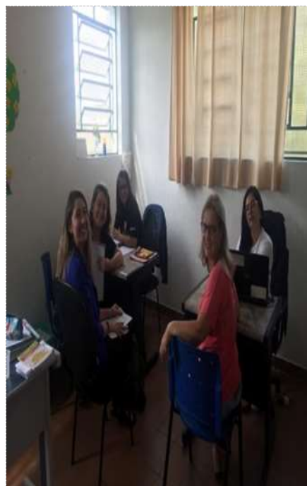
Visita técnica de acompanhamento 20/09/2022