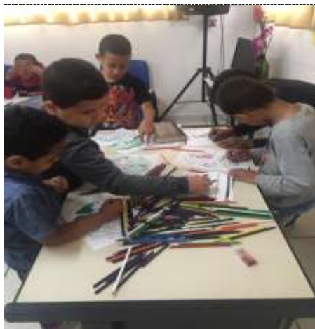
Desenho sobre as emoções 19/09/22