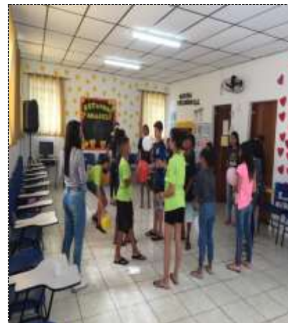
Dinâmica bexiga 26/09/22