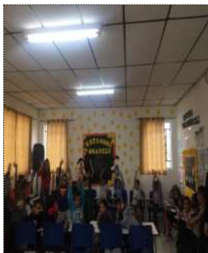
Momento leitura 15/09/22