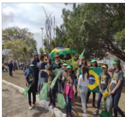
Comemoração cívica 07/09/22

Observações: Atingimos um número significativo de participação dos pais e/ou familiares na reunião socioeducativa de comemoração ao sete de setembro, com mais de 75% de participação dos usuários e familiares.