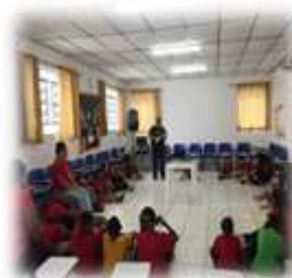
Acolhimento diário 09/01/23 e 16/01/23