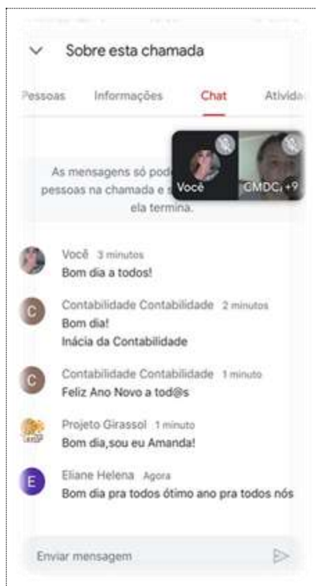
Reunião do CMDCA via google meet / 05/01/23