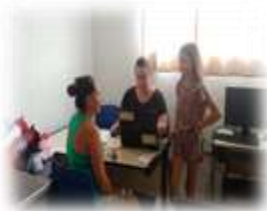
Renovação documentos 12/01/23