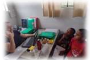
Mediação de conflitos entre usuários 21/01/23