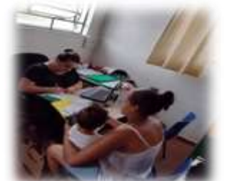
Encaminhamento para a rede/CRAS26/01/23