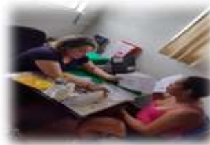
Inserção usuário 18/01/23