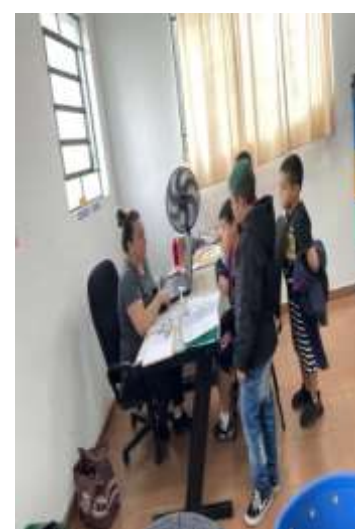
Mediação de conflitos 23/08/2023.