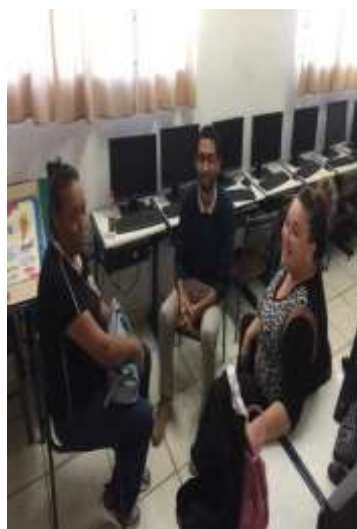
Atendimento familiar 01/08/2023.

Redução das ocorrências de situação de vulnerabilidade social e fortalecimento de vínculos familiares e comunitários.