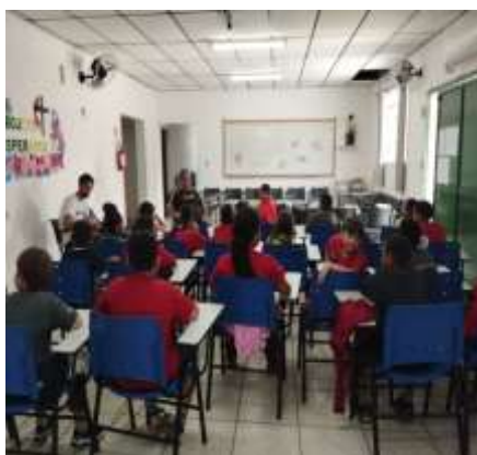
Trabalhos multidisciplinares /psicossocial