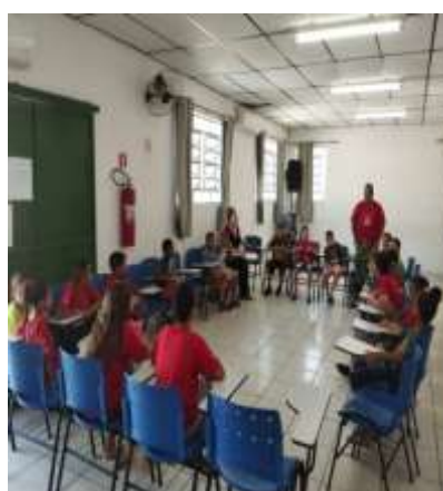
Acolhimento diário 02/10/23