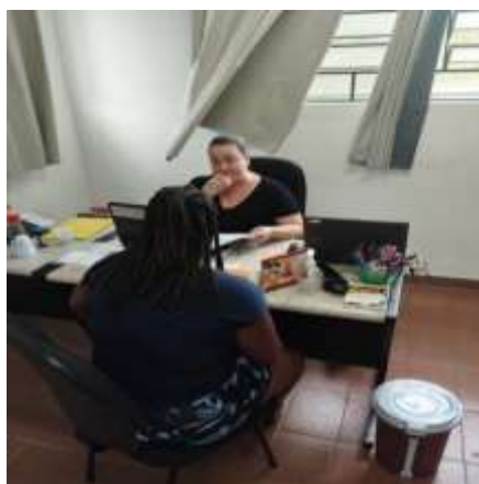
Atendimento familiar 13/10/23

Redução das ocorrências de situação de vulnerabilidade social e fortalecimento de vínculos familiares e comunitários.