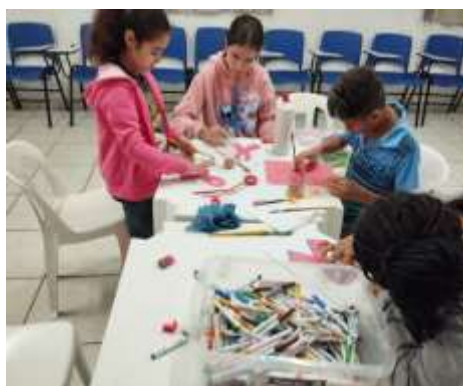
Oficina de Artes/outubro rosa