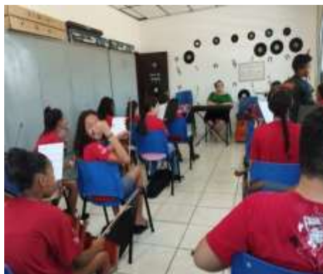
Oficina de Música/ensaio coral