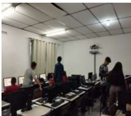
Oficina informática/outubro rosa