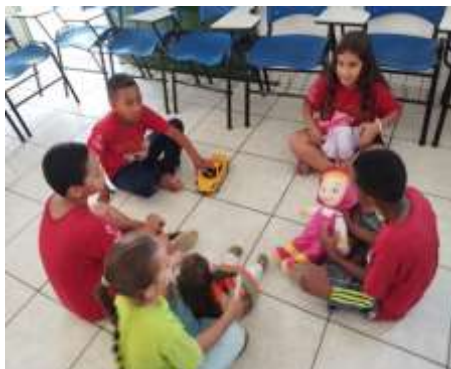
Oficina Lazer e Jogos/10/10/23