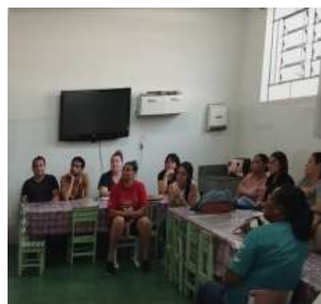
Reunião equipe técnica 10/10/23