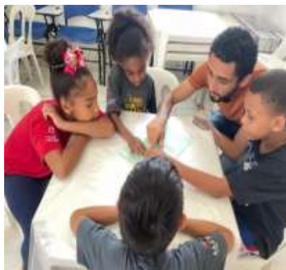
Oficina Psicossocial/compreendendo outubro rosa