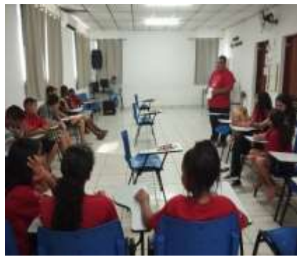
Oficina Lazer e Jogos/ Dinâmica das argolas