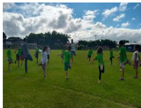
Oficina de Esporte Atletismo 26/06/19