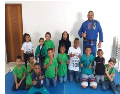
Oficina de Esportes Jiu-Jitsu