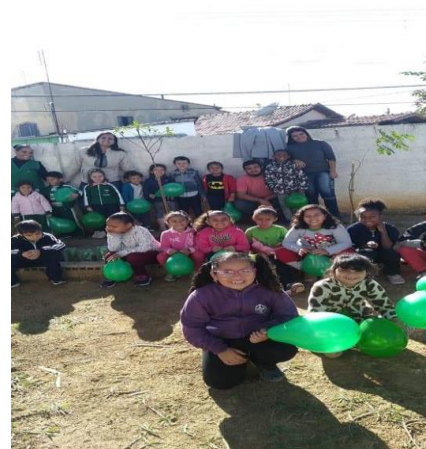
Meio Ambiente 05/06/19