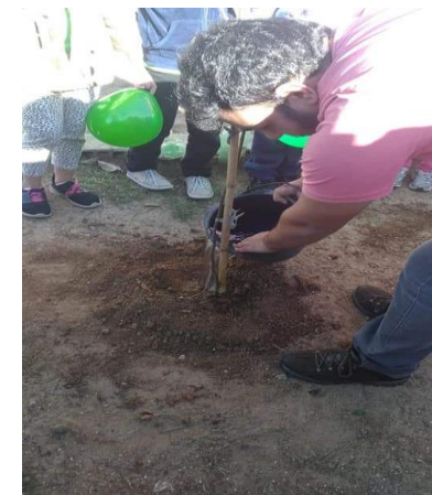
Meio ambiente 05/06/19