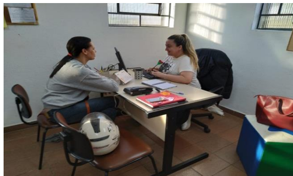
Inserção de Educando 24/06/19