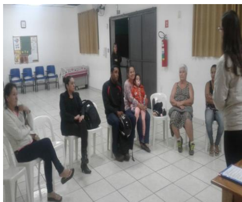
Reunião de Pais 10/06/19

OBS: Na reunião de pais e responsáveis referida anteriormente obtivemos baixa participação nesta edição, sendo justificado pelos pais e responsáveis quanto ao horário de termino das escolas municipais , que mudaram seu horário recentemente para as 18h10 e dessa forma os pais deveriam ir buscar seus filhos. Vale ressaltar que a instituição adota a política de tolerância de 30 minutos.