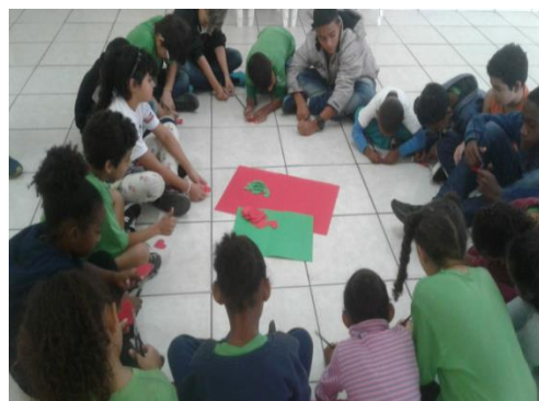
Confeccionando Rosa em EVA 03/06/19