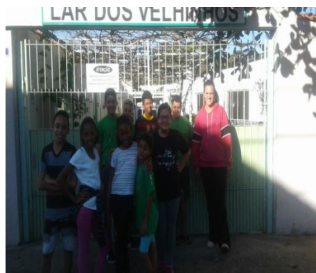
Visita ao Lar 11/06/19