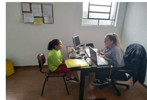
Escuta Individualizada 27/06/19