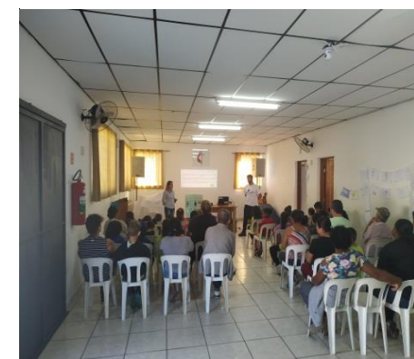
Palestra com os Pais 26/06/19