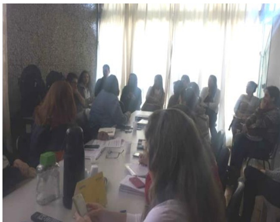
Reunião Extraordinária 06/06/19