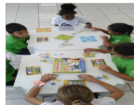
Jogos Recreativos 06/06/19