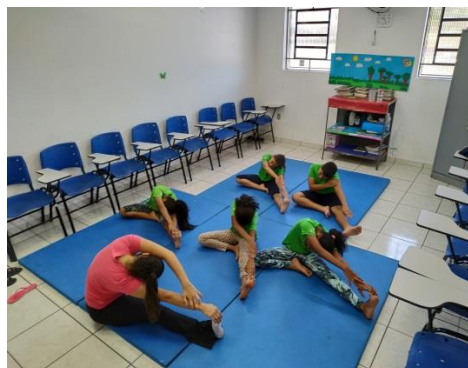
Oficina Psicossocial 04/06/19