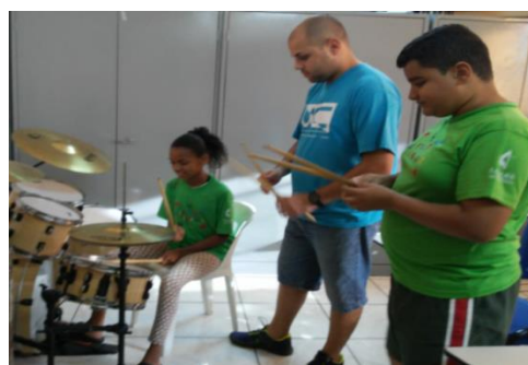
Oficina de Música 17/06/19