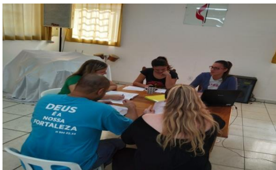
Reunião de Equipe Técnica 03/06/19

OBS: A meta 2 será realizada no segundo semestre.