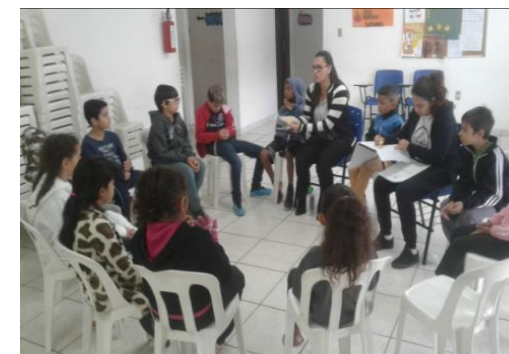
Acolhimento Diário 10/06/19