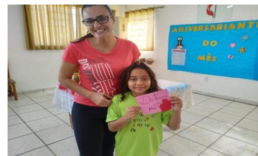
Destaque do Mês 28/06/19