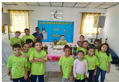
Aniversariante do mês 28/06/19