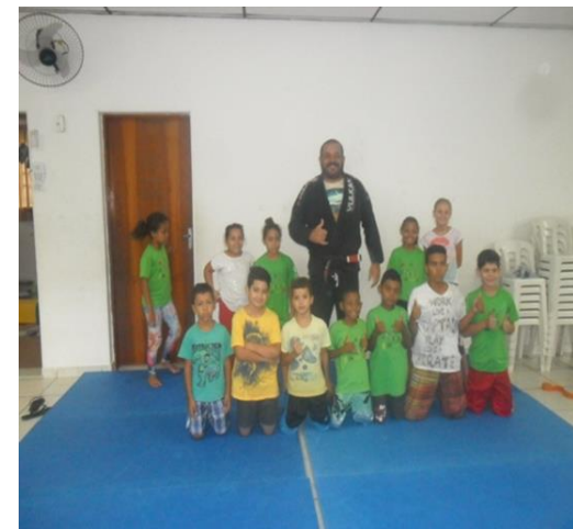
Oficina de Esportes