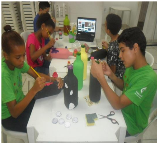
Oficina de Artes