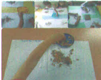
ATIVIDADE DE TEXTURA