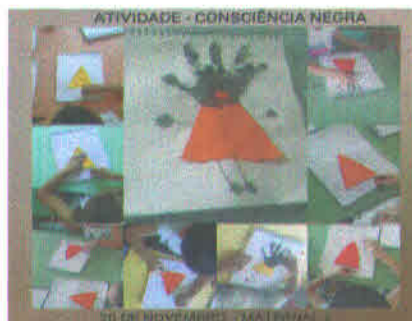
ATIVIDADE - CONSCIÊNCIA NEGRA